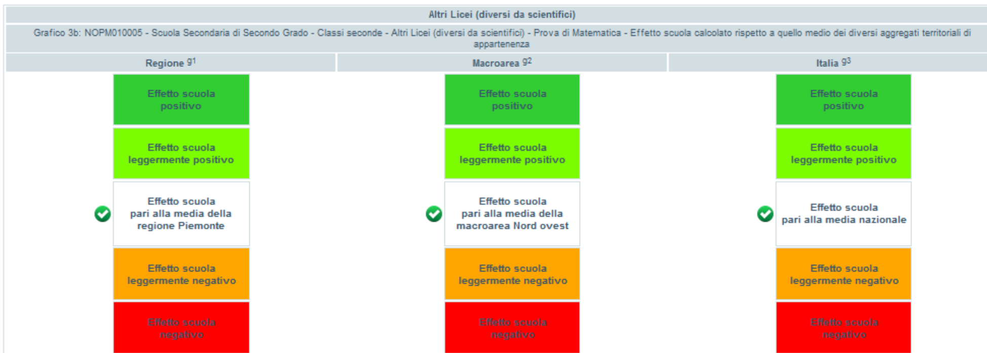
Figura 6 Effetto scuola - Prova Matematica