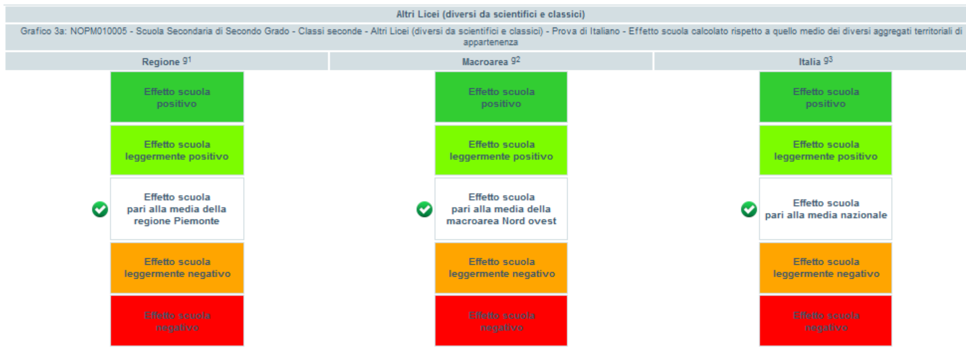
Figura 5 Effetto scuola - Prova di italiano