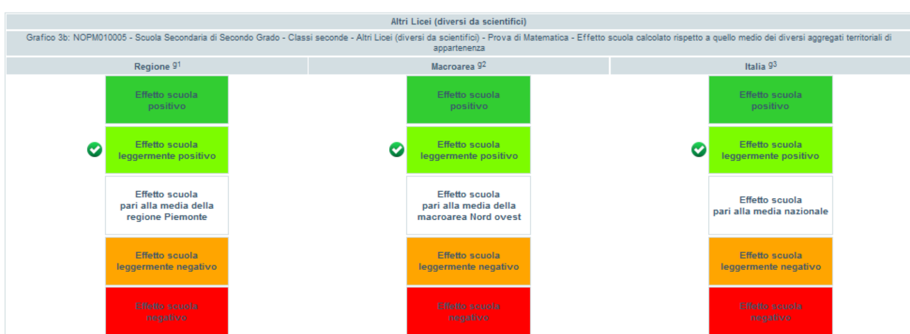
Figura 6 Effetto scuola - Prova Matematica