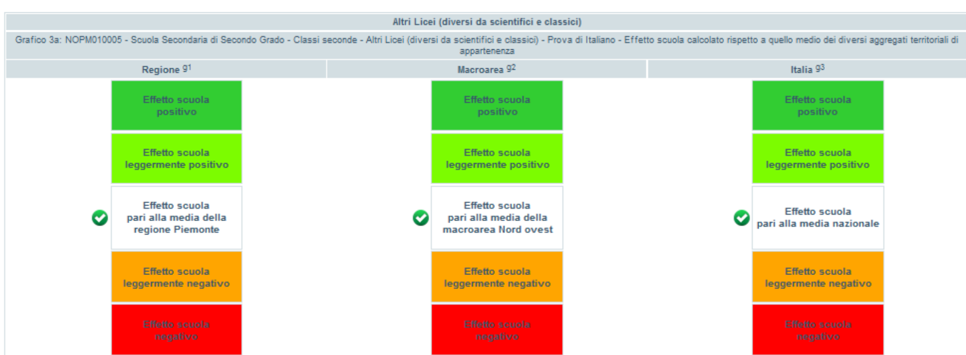
Figura 5 Effetto scuola - Prova di italiano